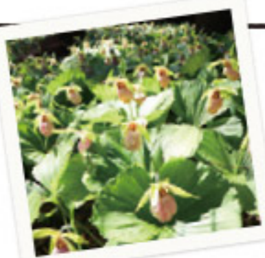
映える写真ならココ!

標高およそ700mの山で、明治末期には地域の催しとして盛んに競馬が行われていたのが名前の由来。2017年に地元住民で立ち上がった「競馬山桜の会」の整備によって、手作りの遊歩道が完成!素晴らしい富士山と西桂の町を一望できます!