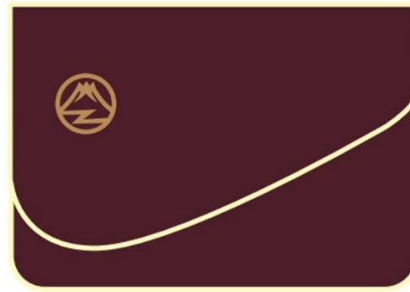
左：富士急行線ルーム宿泊記念硬券